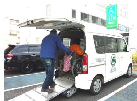
通院の送迎と院内介助 帰りに薬局へも。