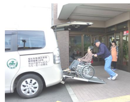
日吉と新羽のデイサービスの送迎